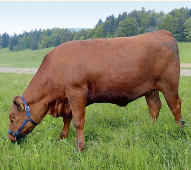
Figure 1 | Le Rumiwatch (licol bleu) et le pedomètre fixé au pied arrière gauche servent à enregistrer le comportement d'ingestion au pâturage et l'activité physique des animaux.

de mesure de la consommation individuelle de petit-lait (trois fois en 2012 et une fois en 2013, voir ci-dessus). Les critères de changement de pâture sont décrits dans l'article de Meisser et al. dans ce numéro en pages 22–29.