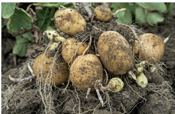
Figure 2 | Formation d'une deuxième génération de tubercules fin juillet 2015 sur Agria à Goumoëns-la-Ville.

Les variétés Bintje et Agria ont créé une deuxième génération de tubercules (fig. 2). Les variétés Désirée, Amandine, Markies, Annabelle, Ditta, Lady Felicia et Verdi ont fortement regermé dans le sol (fig. 3) et ont parfois également créé une deuxième génération. Les variétés qui réagissent ainsi, perdent leur consistance et leur qualité se détériore clairement.