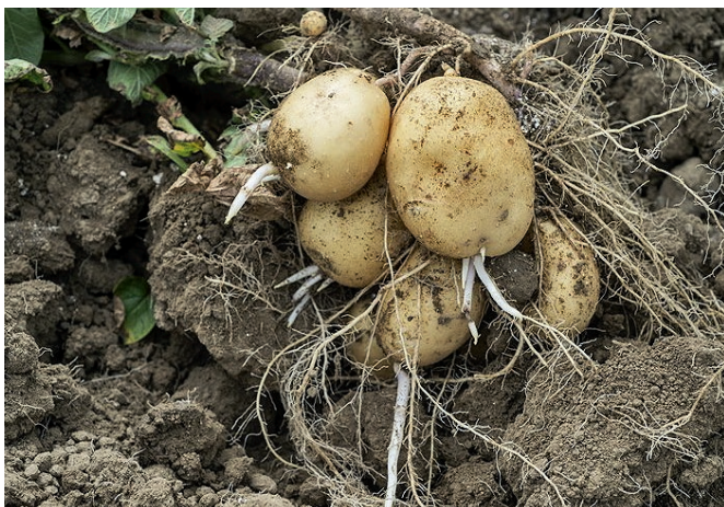
Figure 3 | Regermage dans le sol fin juillet 2015 sur Markies à Goumoëns-la-Ville.