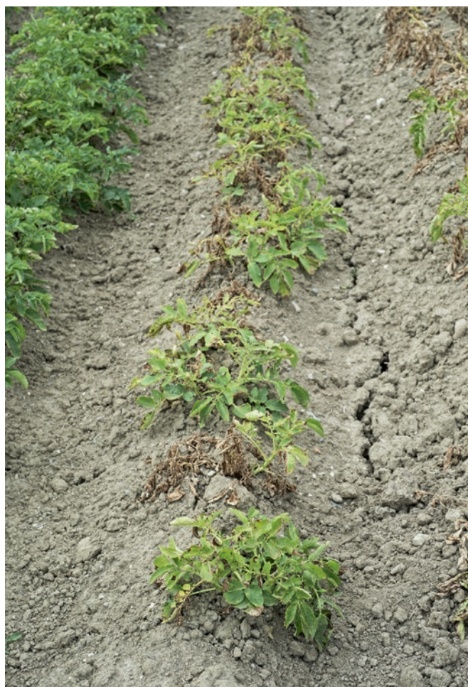
Figure 4 | La variété Charlotte, qui souffre de la sécheresse, meurt rapidement. Une attaque par l'alternariose ( Alternaria solani ), la dartrose ( Colletotrichum coccodes ) ou la verticilliose ( Verticillium spp.) en fin de végétation peut accélérer la sénescence en périodes sèches et chaudes.