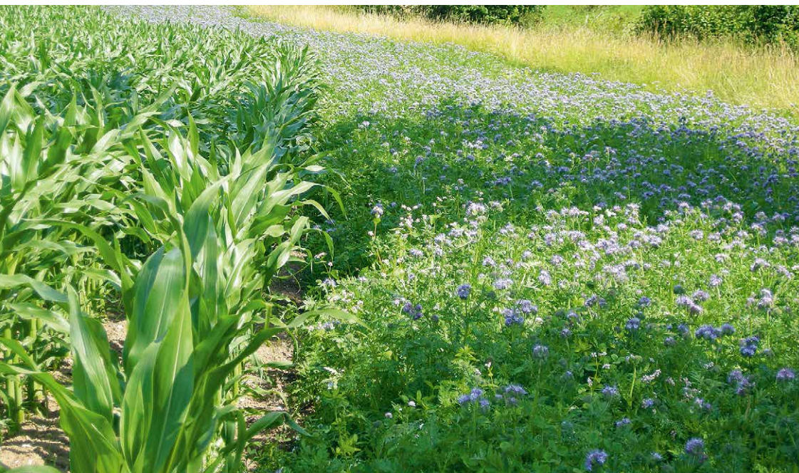
Figure 1 | Les plantes qui fleurissent durant la période estivale de faible miellée doivent améliorer l'offre en nourriture pour les pollinisateurs et autres auxiliaires: bandes fleuries durant le pic de floraison des phacélies.