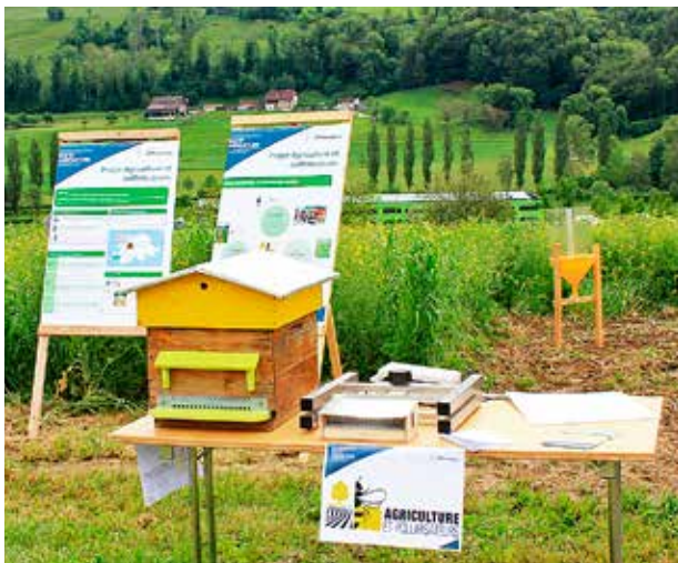
Figure 1 | Stand lors une journée technique avec du matériel de démonstration comme les ruchers test et un piège à abeilles sauvages (arrière-plan droit).